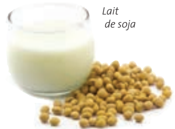
Lait de soja

- Saupoudrez vos plats de levure de bière en paillettes pour avoir le goût du fromage, au lieu du parmesan.